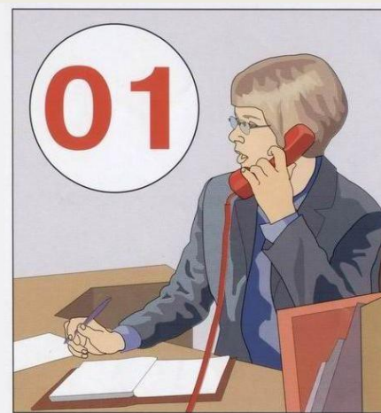
Сообщить о пожаре в пожарную охрану. Задействовать систему оповещения

Наличие запаха перегревшегося вещества и появление легкого, сначала едва заметного, а затем все более сгущающегося и действующего на глаза дыма - это первые верные признаки пожара. Электрические провода, постепенно нагреваясь при перегрузке, сначала "сигнализируют" об этом характерным запахом резины, а затем изоляция воспламеняется и горит или тлеет, поджигая расположенные рядом предметы. Одновременно с запахом резины может погаснуть свет или электрические лампы начнут гореть вполнакала, что иногда также является признаком назревающей