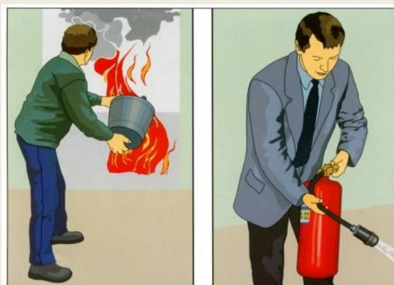
Приступить к тушению пожара первичными средствами

опасности загорания изоляции электропроводов. Когда в помещении, где начался пожар, имеется усиленная вентиляция (открыто окно, дверь на балкон), находящиеся в соседних комнатах люди иногда узнают о начавшемся пожаре не по дыму или запаху гари, а по потрескиванию горящего дерева, похожему на потрескивание горящих в печке сухих дров. Иногда слышен свистящий звук, могут быть видны отблески пламени.